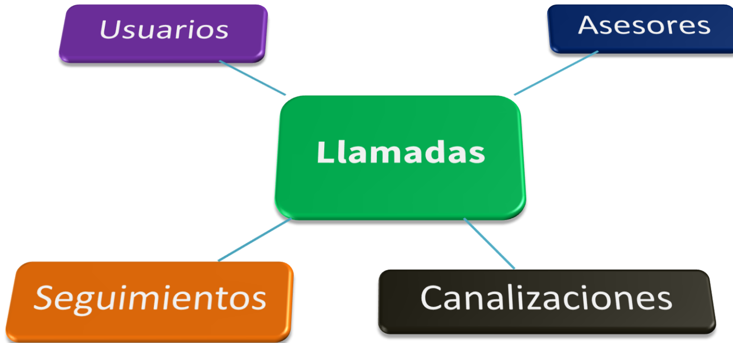
Diagrama de bloques